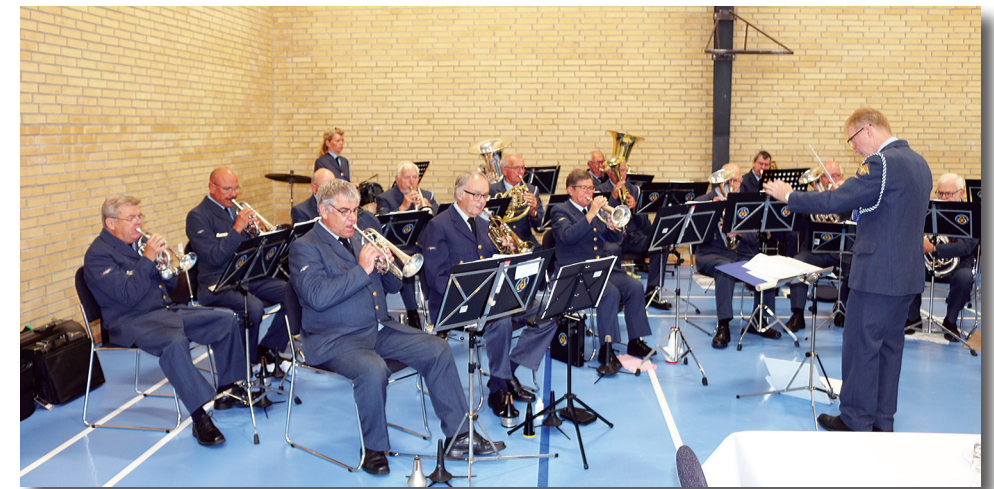
Flyvestation Aalborgs Brass Band

samarbejdes ånd atter i år stillet en bus til rådighed, så soldaterforeningerne med flest mulige af deres smukke faner kunne blive transporteret for at hædre vores soldater og veteraner til arrangementerne, først i Aabybro og senere på Aalborg Forsvars- og Garnisonsmuseum.