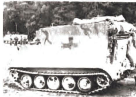
Med forhøjet lastrum og generator benævnes vognen M 557 og benyttes bl.a. som kommandocentral og ambulance.

Det er ingen militær hemmelighed, at M 113's aluminiumspanser kan genbrydes af alle kalibre over 7.62 mm. Specielt er aluminiumspanseret sårbart overfor alle former for hulladningsvåben.