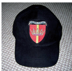
Lille skjold på pinnål