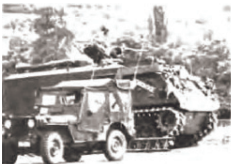
Det belgiske infanteri har indtil for nylig anvendt M 59 - forgængeren for M 113. Nu har Belgien indført YPR 765.

Langt de fleste lande, som anvender M 113, har selv foretaget modifikationer på vognene, og forskellige amerikanske firmaer tilbyder færdige modifikations-sæt, der kan opfylde næsten et hvilken som helst krav, en bruger måtte stille.