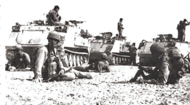
Israels panserinfanterideling med M 113 "ZELDA". Bemærk affutager til 7,62 mm maskingevær og holdere til mandskabets udrustning på PMV'ens sider. Vognen helt til højre er beskyttet med aktiv-panser.

XM-765 blev afprøvet af en række NATO-lande, men er foreløbig kun indført i Holland og Belgien under betegnelsen YPR 765. Udover tårnet og den kraftigere pansring er YPR 765 forbedret på en række andre områder. De integrerede brændstoftanke er udskiftet med to tan-