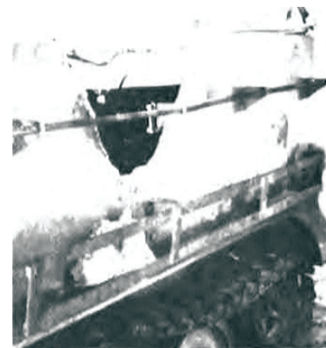
M 113 truffet af en russisk-fremstillet Sagger-panserværnsrakets. Her hjælp udrustningen ikke. . .

ke placeret over bagskærmene. Det giver bedre plads for mandskabet i kamprummet og mulighed for at medbringe mere ammunition. Vognen er også forsynet med skydeskår og periskoper, så infanterigruppen kan betjene sine våben inde fra vognen.