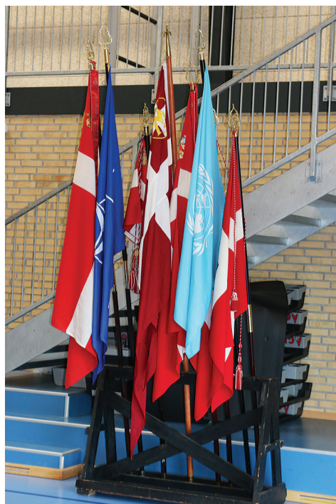
Det ene geværstativ med ca. halvdelen af de fremmødte flotte faner

Således holdt en bus klar ved museet til afgang klokken 09.00 med faner og folk fra soldaterforeningerne, så man kunne være på plads til kl. 10.00 i DGI hallen i Aabybro til formiddagens flagdagsarrangement i Jammerbugt Kommune. I timen inden klokken ti mødte flere og flere veteraner og pårørende op i hallen og fandt en plads ved bordene, der stod dækket med hvide duge, kaffe og postelin. Ved indgangen til salen stod rigeligt med håndsprit, som blev flittigt benyttet, og man hilste på hinanden på "nydansk" med albuestød – ingen håndtryk og kram – inden man satte sig ved borde og stole, som var placeret med den afstand, der var anbefalet, af hensyn til coronaen.