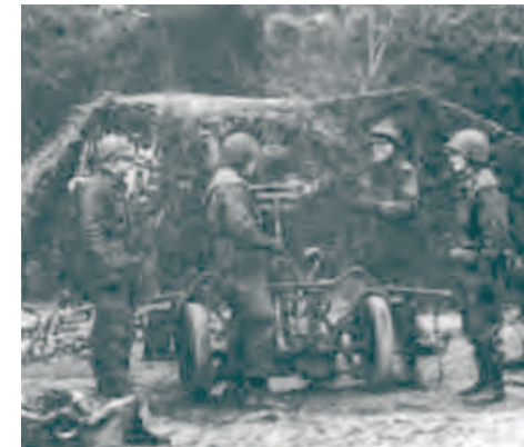
Morternerne fra såvel 1. som 2. bataljon skød koordineret ildoverfald i samarbejde med 3. Artilleriafdeling. Samarbejdet gik upåklageligt, men de genindkaldte observatører blev ikke benyttet nok. Artilleriet ledede ilden.

nemgik samme gemopfriskning som de øvrige, men det absolutte højdepunkt for dem var de planlagte skydninger i samarbejde med 3. Artilleriafdeling fra Skive, der var lagt i brigaderamme. Heri deltog også den mønstrede tunge mortardeling fra 1. bataljon/Dronningens Livregiment. Skydningerne i Oksbøl var som sagt lagt i brigaderamme. Der var samlet enheder fra nær og fjern, man øvede koordineret ildoverfald i såvel dagslys som mørke. To tunge mortardelelger, to kampvognseskadroner, to panserinfanterikompagnier og sidst men ikke mindst 3. Artilleriafdeling/Nørrejske Artilleriregiment fra Skive. Samarbejdet de mange våben imellem gik, efter de første hurdler var overvundet, gnidningsfrit. Det lykkedes at få ildoverfaldene gennemført efter planen, og det var et imponerende syn at se de mange våben skyde samtidigt mod samme målområde. Dog gav