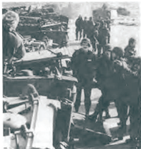
Bataljonens nye køretøjer, PMV' er, vakte opsigt blandt de mønstrede. Nogle stiftede for første gang bekendtskab med disse. Her er man ved at gøre klar til øvelse i Borris. Der blev øvet de mest soldatermæssige fag og ting.