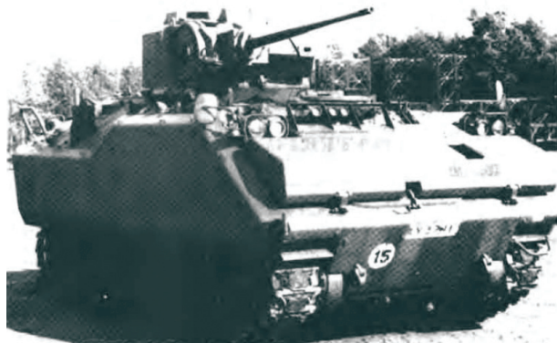
YPR 765 fra den hollandske hær. PMV'en er bevæbnet med en 25 mm kaskinkanon og et 7,62 mm maskingevær, der monteres i hullet i venstre side af tårnet.

Også andre lande har forsøgt at forbedre pansringen på M 113. Den israelske hær, der har over 4000 M 113, har på en forholdsvis simpel måde opnået en bedre beskyttelse af det opsiddede mandskab. I holdere på PMVens sider opbevares mandskabets personlige udrustning samt evt. ekstra vanddunke. Det giver nogen beskyttelse mod sprængstykker og lette panserværnsvåben.