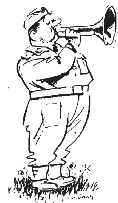
Menig 66 blæser honnør